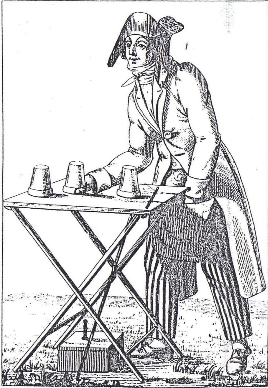
Prove di stampa -