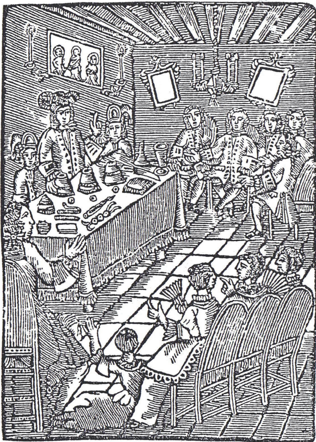
Prove di stampe