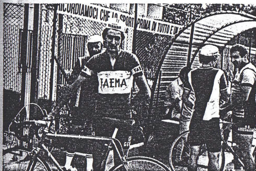
Ogliaro: il solito vincitore sulla bi ci.