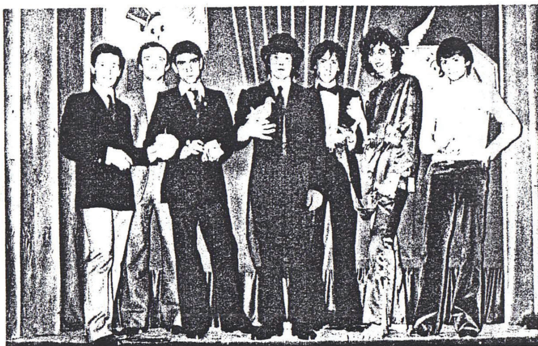
Gli altri partecipanti al Concorso Magico di Primavera