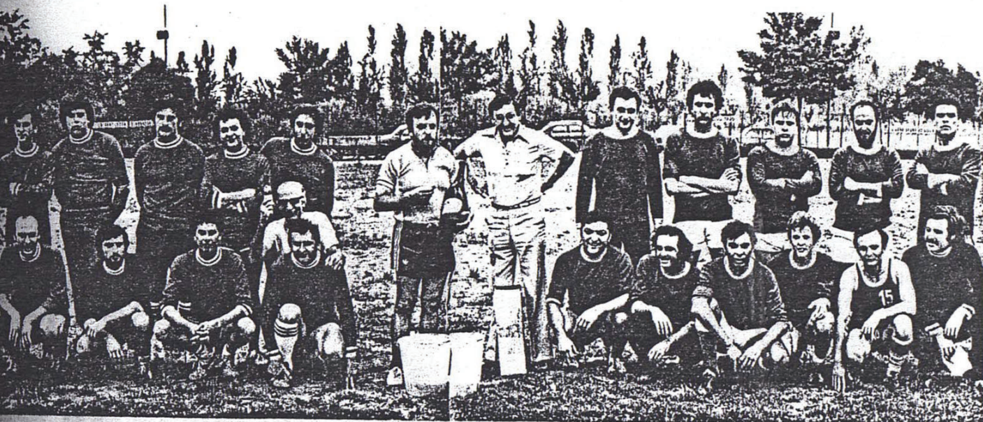
Coppa del Mondo dei maghi-calcianti?