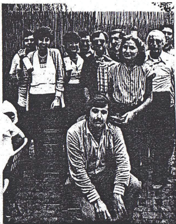
I vincitori della caccia al tesoro