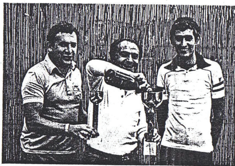
1° e 2° classificato